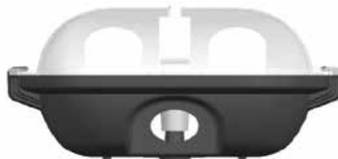
Ürünün Baş Kısmından Görüşünü